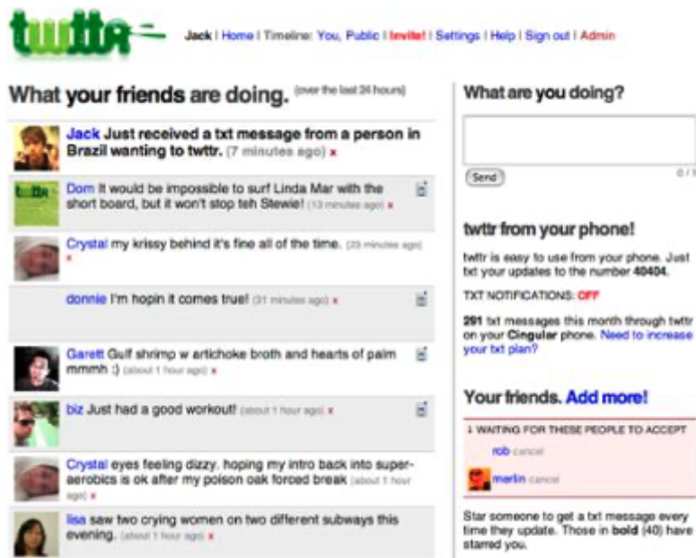
Figure 3 : La première page publique pour « Twttter » (Twitter) en 2006

réseau est lentement devenu fantomatique dans les années 2010 ; le serveur principal du réseau lui-même finissant par devenir inactif. Les manifestants dans les nouveaux mouvements sociaux utilisèrent alors progressivement Twitter et Facebook au lieu d'Indymedia 21 . Les programmeurs à l'origine de l'infrastructure technique d'Indymedia ont également quitté leurs fonctions. Certains maintiennent toujours le serveur de messagerie riseup.net , qui est le plus grand fournisseur de messagerie à but non lucratif au monde. Cependant, deux des programmeurs radicaux derrière Indymedia et TxtMob - Blaine Cook et Evan Henshaw-Plath – ont ensuite créé Twitter dans la Silicon Valley 22 .